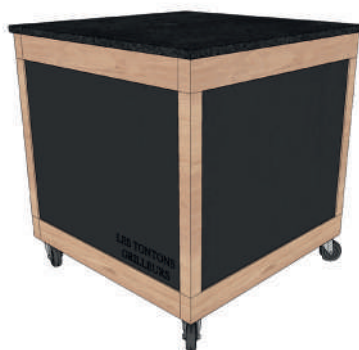
LULU La Nantaise SOLO avec porte